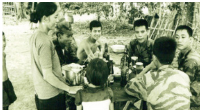
Bia lớn con Cọp có trái Thom