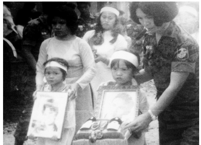
Nữ Quân Nhân QLVNCH phục vụ trong mọi công tác xã hội và văn hóa.