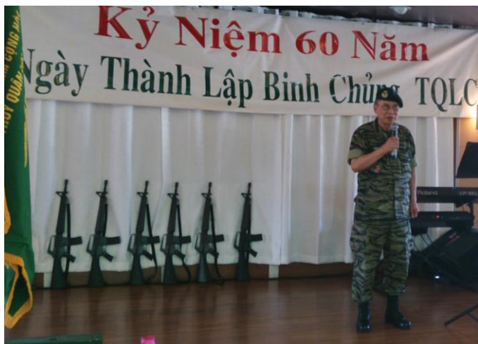
Đại Tá TLP/SĐTQLC