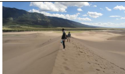
Great Sand Duns

Tại Hoa Kỳ có rất nhiều National Park đã được Tổng Thống Theodore Roosevelt ký sắc lệnh bảo vệ. Có dịp đến viếng những nơi này, chúng ta sẽ thấy sự bảo tồn di tích rất hài hòa, phù hợp với thiên nhiên và giá trị thời gian (lịch sử) của nó. Những Nation Park này được chăm sóc, và dĩ nhiên vào viếng thăm, phải trả một lệ phí. Anh em chúng ta muốn có những giây phút sinh hoạt gia đình trong cảnh thiên nhiên, cắm trại qua đêm trong các National Park, điều kiện trên 62 tuổi, khi vào cổng một National Park, hỏi người trách nhiệm, họ sẽ hướng dẫn làm thẻ với lệ phí $10, thẻ này sẽ có hiệu lực ngay lập tức, và vĩnh viễn vào tự do bất cứ một National Park ở Hoa Kỳ. Xin được giới thiệu 2 trong số 4 National Parks (Mt Evans, Rocky Mountain, Great Sand Duns, Mesa Verde) cùng cắm trại ở Colorado mà tôi viếng thăm vào hạ tuần tháng 8, 2014.