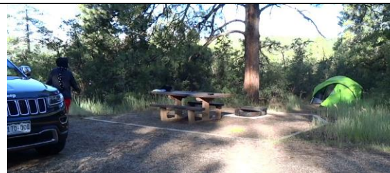
Target Tree Camping ground