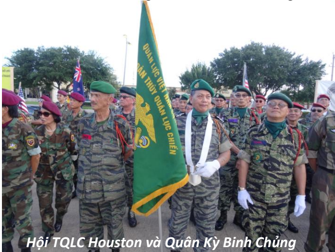
Hội TQLC Houston và Quân Kỳ Bình Chung

Hội TQLC Houston tham dự ngày Quân Lực 19 tháng 6, 2016 tại Tượng Đài Chiến Sĩ VNCH và Đồng Minh, mặc dù 6 giờ chiều nhưng vẫn còn oi bức, anh em TQLC và gia đình vẫn đến tham gia.