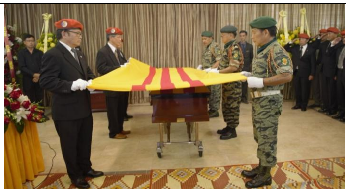
Lễ phủ kỳ trước giờ tiễn anh đi