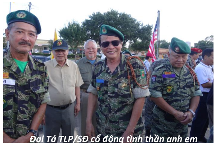
Đại Tá TLP/SĐ cổ động tinh thần anh em