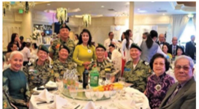
BÀN GIAO -----QUỐC HẬN 2023-----NGÀY QUÂN LỰC