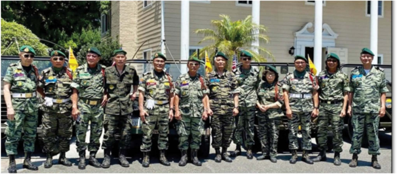
SINH HOẠT TQLC NAM CA