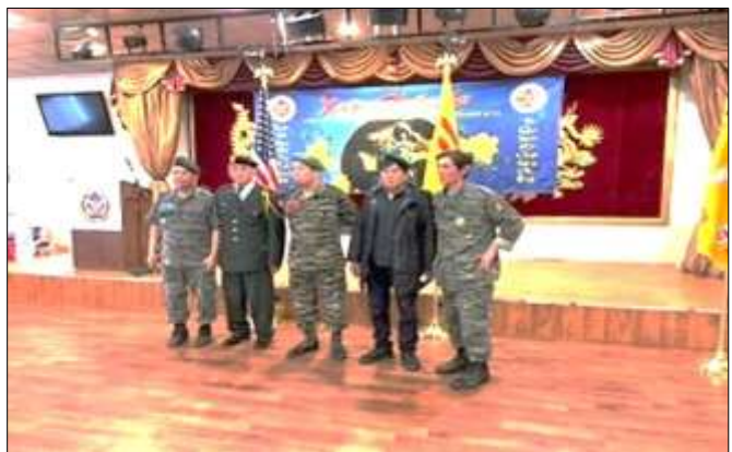
MX THAM DỰ ĐÁM TANG CAO MẠNH CƯỜNG