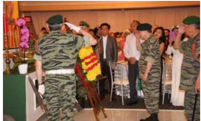
NEW ORLEANS July 09 /2023 TẶNG HOA