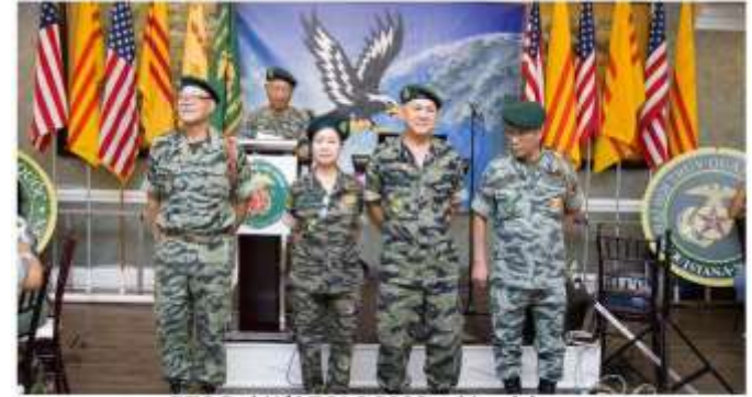
BTC Đại Hội TOLC 2023 tại Louisiana