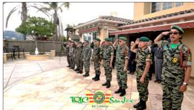
HỘI TQLC SAN JOSE